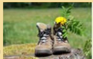
La Foulée Verte

Venez nous rejoindre. Vous passerez une agréable journée.